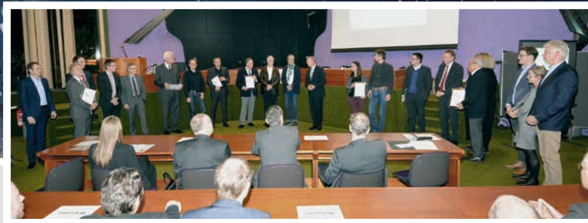
Heinz Eininger, Landrat des Landkreises Esslingen